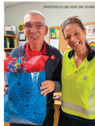
PHOTOS CLUB JOIE DE VIVRE